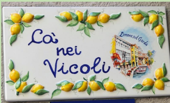
En route pour Limone , la cité du citron !