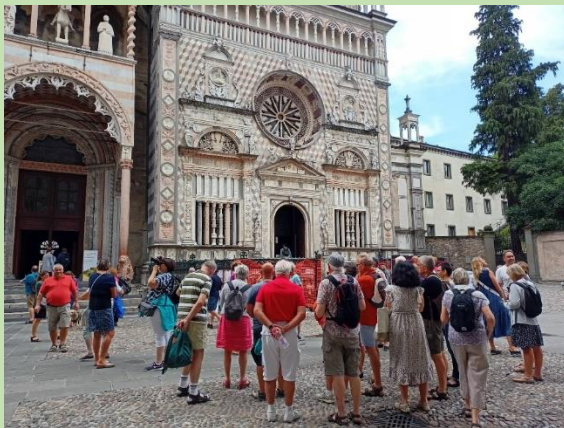
La Basilique Santa Maria Maggiore