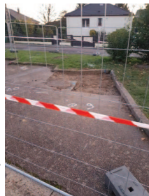
Photo : Affaissement du parking rue de la république

Rue de la république : Des forages pilotés par le service de l'assainissement de la métropole sont réalisés depuis le 18 novembre sur un parking suite à l'apparition d'une cavité... à suivre.