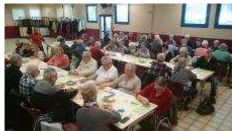
Loto du 24 février