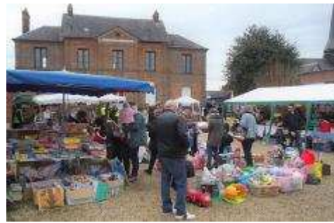
Déballage-Portes ouvertes dans la cour 2 fois par an

Facebook : Association saint Vincent de Paul de Boos