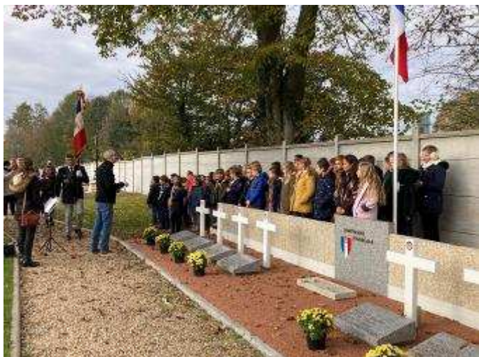
Au Carré Militaire

Merci aux enseignants de l'école de Belbeuf ainsi qu'à l'école de Musique du Plateau Est pour le temps consacré à la préparation des chants et pour leur participation à la transmission de la mémoire auprès des enfants.