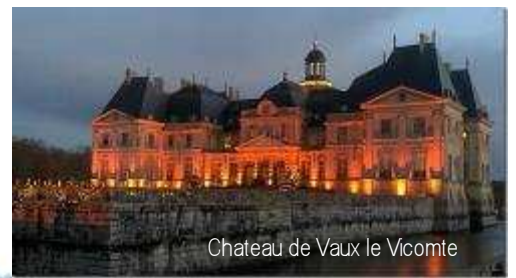
Chateau de Vaux le Vicomte

L'application effective de ce programme est évidemment soumise aux contraintes sanitaires aussi imprévisibles à moyen et court terme que pénalisantes si elles devaient se durcir.