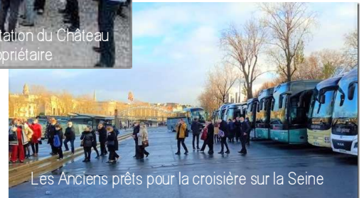
Les Anciens prêts pour la croisière sur la Seine

Nous avons évidemment le souci constant de maintenir à la fois la convivialité que nous avons vue se réinstaller dès la reprise des activités, mais aussi de préserver nos amicalistes de tous risques en matière de santé.