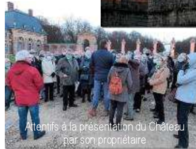
Attentifs à la présentation du Château par son propriétaire