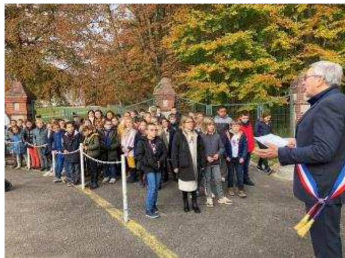
Devant le Monument aux Morts